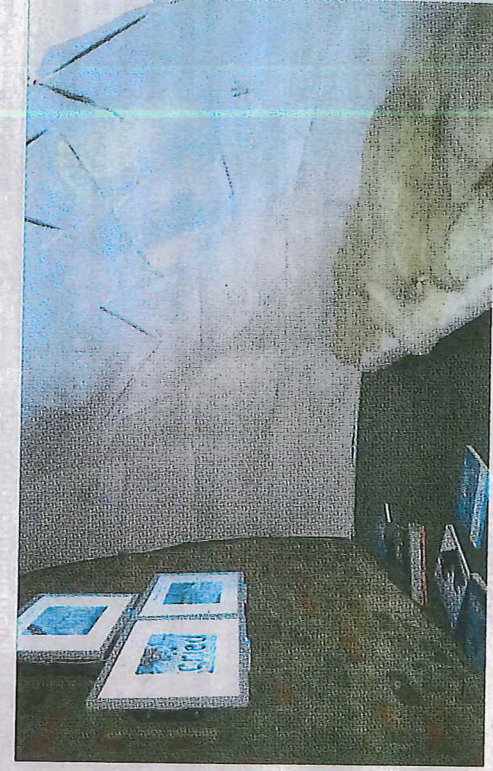
Instagram-værket »Snow« af kunstneren Shelley Jackson.

faktiske forhold. Til fortællingerne vises en række billeder, der viser de forskellige klimatiske følger af udledning af drivhusgasser.